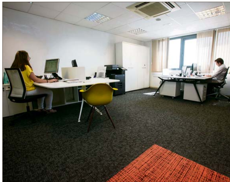
La calidad de sus proveedores supone una pieza insustituible de su servicio. MANU MIELNIEZUK